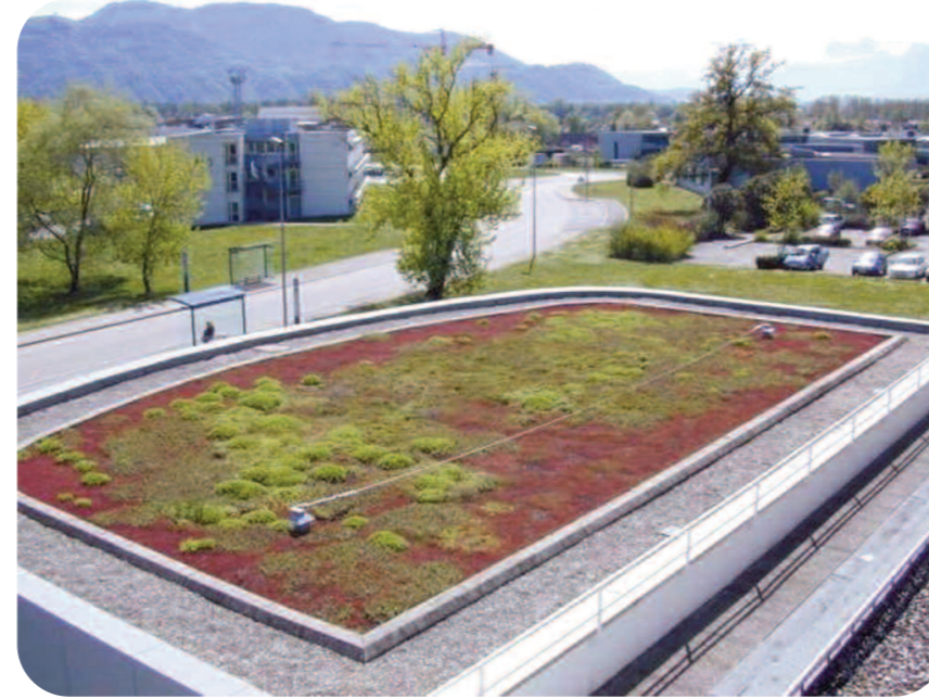
Toiture végétalisée sur une école d'ingénieur en Isère (38)