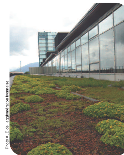
Office fédéral de la statistique à Neuchâtel (Suisse)